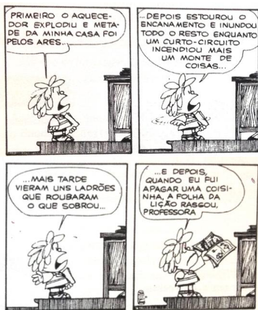
Quino. Mafalda . São Paulo: Martins Fontes, 1990.

01. As histórias em quadrinhos constituem um gênero de texto que, como todos os outros, têm a sua função comunicativa. Analisando a historinha acima, podemos afirmar que: