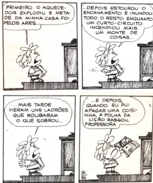
Quino. Mafalda . São Paulo: Martins Fontes, 1990.

12. As histórias em quadrinhos constituem um gênero de texto que, como todos os outros, têm a sua função comunicativa. Analisando a historinha acima, podemos afirmar que: