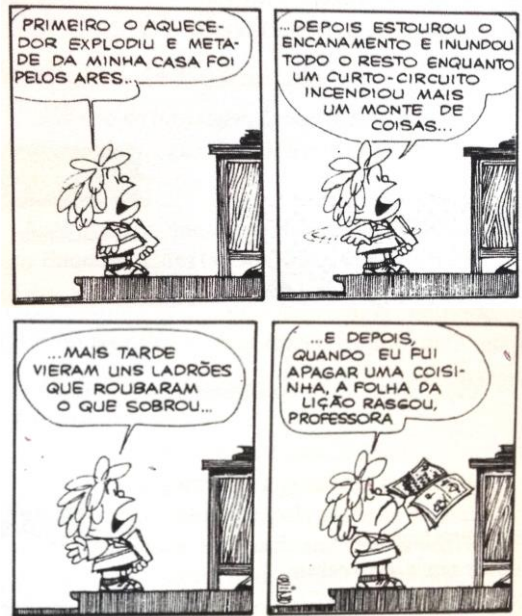
Quino. Mafalda . São Paulo: Martins Fontes, 1990.

05. As histórias em quadrinhos constituem um gênero de texto que, como todos os outros, têm a sua função comunicativa. Analisando a historinha acima, podemos afirmar que: